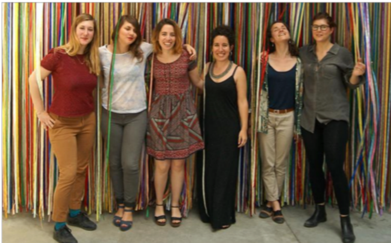
Les six curatrices devant l'œuvre du suédois Jacob Dahlgren, "The wonderful world of abstraction".