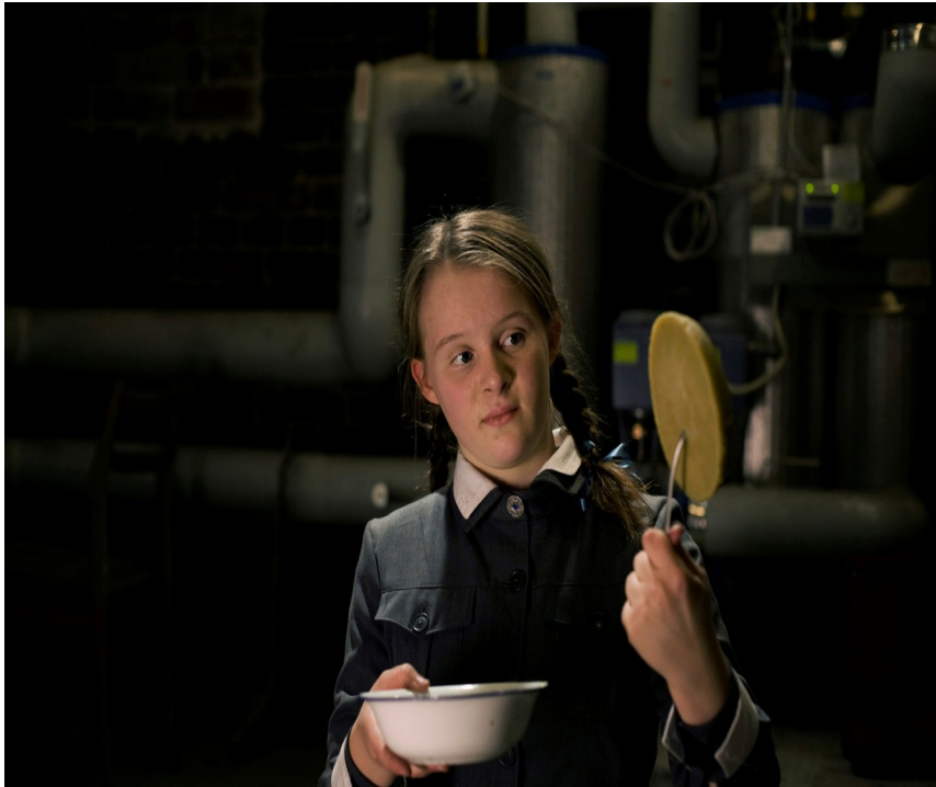
Under a Burning city (2010)