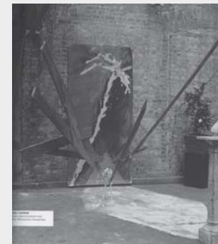
Marek Kijewski, A, 1987, piece lost, photo Tomasz Sikorski