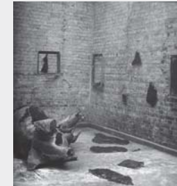
Marek Kijewski, untitl., 1986, piece lost

It was knick-knack, I modified a little, I made it longer legs, mounted it on steel rods so that it kind of floated above the ground. I also took some planks and made wood shavings which I painted red [...]. The shavings were liked cartoon sound waves, like a scream, a small creature with a huge scream, the elephant was telling the world something truly terrible. I had to place it higher to take it outside earthly context. The third work was a bird, a bird's beak actually, a beak-head similar to the flying beak-asses. It was bronze and so hideous [...]When I said it was an eagle, everybody fell about laughing. An ugly thing with steel teeth. It had legs and stood on a pedestal on an exposed place, like portraits of Lenin in the past, and it claimed to be an eagle....”