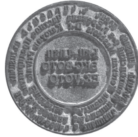
"Le Sceau", (1994-1996, Erevan)

Dans la collection Archive-Practice, le Sceau de la galerie Ex-Voto représente la notion de transition.